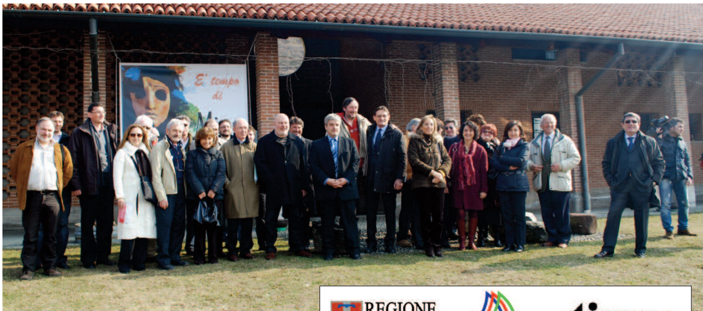
I partecipanti italo-svizzeri all'incontro di Sizzano.